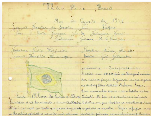
Figura 1 - Aspecto do jornal escolar Tudo pelo Brasil

Os textos dos jornais eram manuscritos e ilustrados sobre folhas de papel com linhas. Portanto, os exemplares têm um aspecto artesanal, um diferindo do outro quanto à composição estética, embora guardando um conteúdo idêntico. Um mesmo número do Tudo pelo Brasil , por ter sido copiado pelas mãos de diferentes crianças, apresentava contrastes quanto ao tipo de escrita e sua disposição nas páginas, bem como diferiam os desenhos, uma vez que podiam ter sido feitos (ou copiados) por autores diversos.