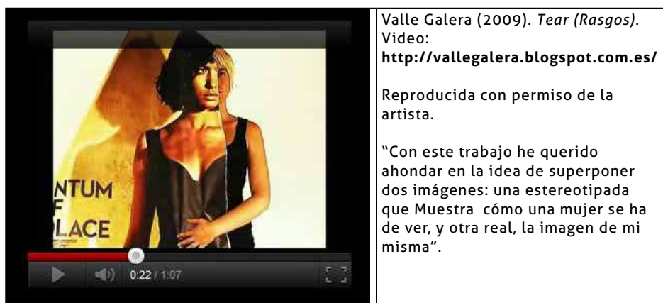
Imagen 1. Ejemplo de cómo las imágenes son presentadas a los jóvenes.

Para el trabajo con estas imágenes y la posterior producción artística que realicen los jóvenes, se plantea la posibilidad de, primero ver dialógicamente las obras y el sentido que aparece en el resumen de cada una de ellas (ver imagen 1), después ver cómo se vinculan con ellas y que relaciones construyen y, en una tercera fase, promover que las respuestas y observaciones se transformen en la obra de cada joven (o de grupos entre ellos).