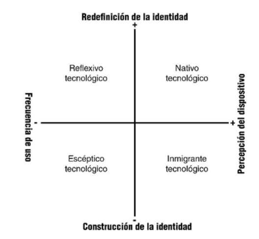
Figura 1 – Tipología de consumidores tecnológicos, cada tipo se correlaciona con uno o más ejes

El modelo central expone cuatro categorías obtenidas en la fase final de la investigación: Nativos tecnológicos , Inmigrantes tecnológicos , Reflexivos tecnológicos y Escépticos tecnológicos , estas representan las posiciones discursivas relativas a cada sujeto, permitiendo su identificación en un orden simbólico individual y colectivo.