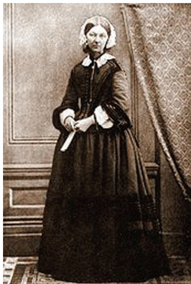
FIGURA 2 – Florence Nightingale, em 1858

Só em 1858, as descobertas de Louis Pasteur viriam a derrubar definitivamente a teoria da geração espontânea dos germes, substituindo-a pela Biogénese, segundo a qual, a matéria viva procede sempre de matéria viva, colocando, assim, em causa, as considerações dos reformadores sanitários da época (Wikipédia, 2010).