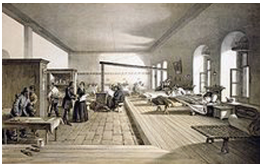
FIGURA 3 – Desenho de uma enfermaria de Scutari

preconceitos do sexo masculino; crescente número de feridos e doentes vindos da frente de batalha; indisciplina e falta de preparação das suas enfermeiras (Graça, Henriques e Isabel, 2000).