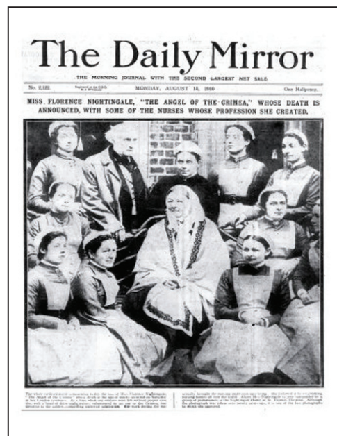
FIGURA 5 – Capa do jornal “The Daily Mirror”, no dia da morte de Florence Nightingale

Ao longo da sua vida, Florence Nightingale escreveu entre 15 a 20 mil cartas a amigos e conhecidos distinguidos e redigiu cerca de 200 obras repartidas entre livros, relatórios e panfletos, nos quais estão bem patentes as suas crenças, observações e desejos de mudança nos cuidados de saúde (Attewell, 1998). Mesmo depois dos oitenta anos de idade, continuou a trabalhar, reunindo dados e escrevendo acerca de Enfermagem e cuidados de saúde (Graaf, 1989).