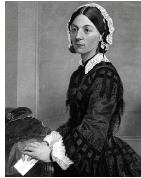
FIGURA 1 – Retrato de Florence Nightingale