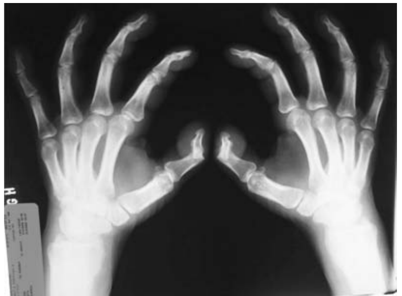
Fig. 5 – Radiograma evidenciando reacção periosteal contínua, espaços articulares conservados e edema de partes moles das mãos

Os achados laboratoriais da OHP são similares aos da OHS; a velocidade de hemossedimentação (VHS) pode estar elevada; os