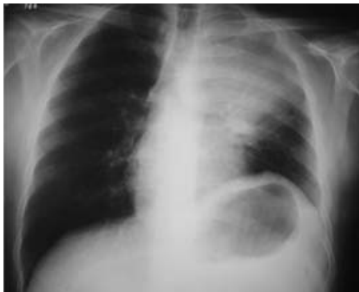
Fig. 2 – Radiograma de tórax evidenciando massa pulmonar e atelectasia no pulmão esquerdo