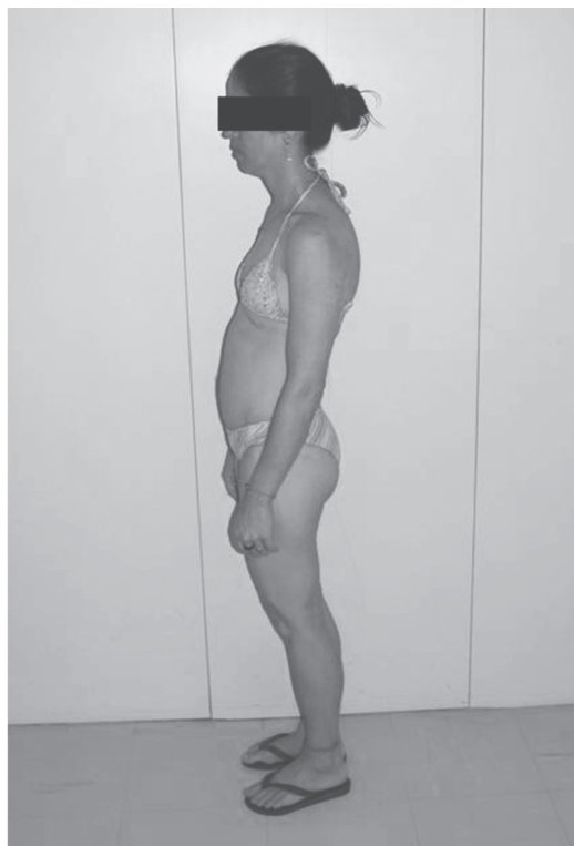
Fig. 1 – Fotografia da doente em perfil

desdobramento e hiperfonese de segunda bulha em foco pulmonar e sopro sistólico de ++/6 em focos tricúspide e aórtico acessório. Aparelho respiratório: intensa dispneia em repouso, uso de musculatura acessória e tiragem intercostal; à auscultação, murmúrio vesicular audível diminuído globalmente, sem ruídos adventícios. Abdómen: fígado era palpável a 6 cm do rebordo costal direito e em epigástrio levemente doloroso. Nos membros inferiores observava-se edema +++/4 bilateralmente depressível e sem sinais flogísticos. Diante da gravidade do quadro, a doente foi internada. Os exames complementares mostraram: