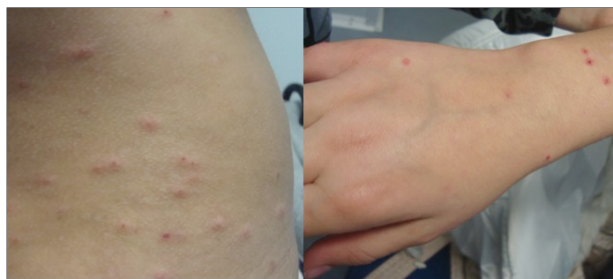
Figura 3. Lesões cutâneas características de prurigo estrófulo.

As lesões cutâneas podem ter início em poucos minutos ou horas após a picada 3 e apresentam uma evolução variável, com duração habitual de dias, mas algumas, par-