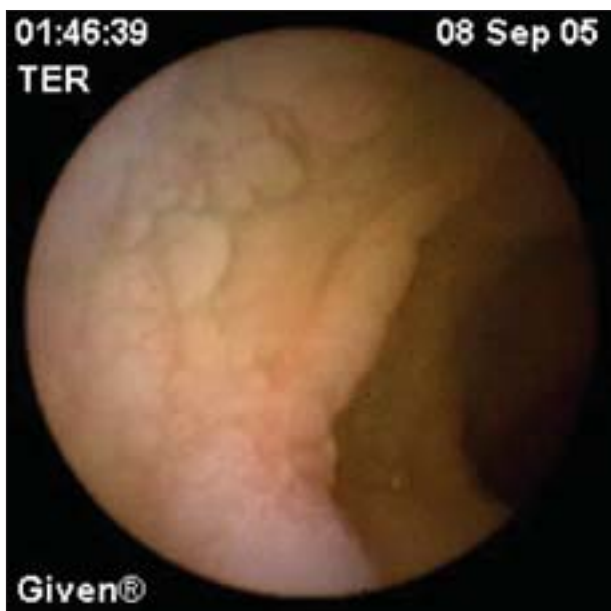
Figura 2 - Aspecto atrofico da mucosa duodenal numa doenca celíaca (imagem de videocápsula endoscópica).

No trabalho previamente mencionado, documentou-se uma resolução histológica significativa aos 12 meses de restrição de glúten, apenas nos doentes mais jovens (15-30 anos). Pelo contrário, os enfermos acima desta faixa etária apresentavam melhoria das lesões, mas sem significado estatístico, mesmo aos 24 meses de tratamento. Estes autores consideram que a duração da exposição ao glúten é o factor determinante na velocidade de recuperação histológica nos adultos, com uma relação inversamente proporcional (31) .