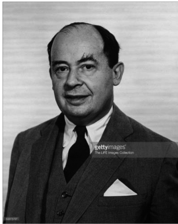
Fig. 2 – John von Neumann.