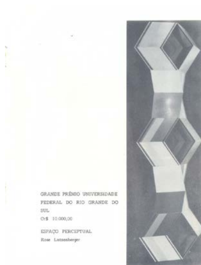
Figura 6 · Catálogo do II Salão de Artes Visuais (UFRGS). Capa e página com atribuição de prêmio para a escultura Espaço Perceptual, de Rose Lutzenberger.