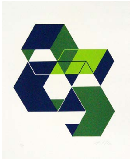
Figura 2 · Rose Lutzenberger. Visão multidirecional (1971). Serigrafia sobre papel (33/50), 66,5 x 48,5 cm. Registro: 346.1520. Acervo da Pinacoteca Barão de Santo Ângelo (UFRGS)