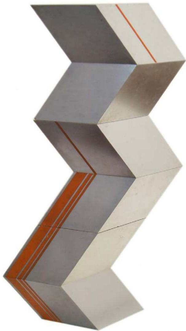
Figura 1 · Rose Lutzenberger. Sem título, sem data [circa 1970]. Escultura em (três) módulos de alumínio, 100 x 50 x 40 cm. Registro: 294. Acervo da Pinacoteca Barão de Santo Ângelo (UFRGS)