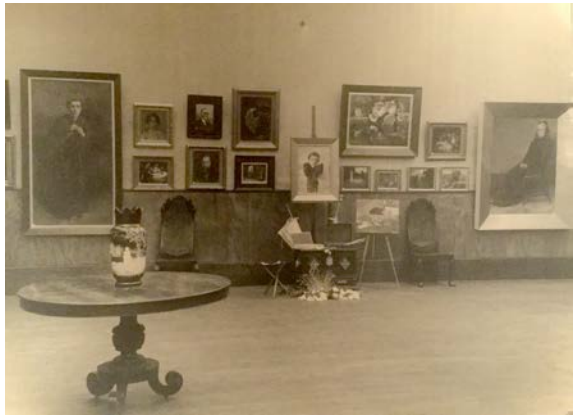
Figura 3 · Fotografia de Aurélia de Sousa, Aurélio da Paz dos Reis. s/d. Casa-Museu Marta Ortigão Sampaio. Figura 4 · Aspeto da Exposição de Homenagem Póstuma à grande Pintora D. Aurélia de Souza, 1936. Casa-Museu Marta Ortigão Sampaio, Porto.