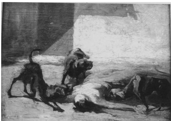
Figura 7 · Aurélia de Souza, Santo António , c. 1902. Óleo sobre tela. Coleção Casa-Museu Marta Ortigão Sampaio, Porto.