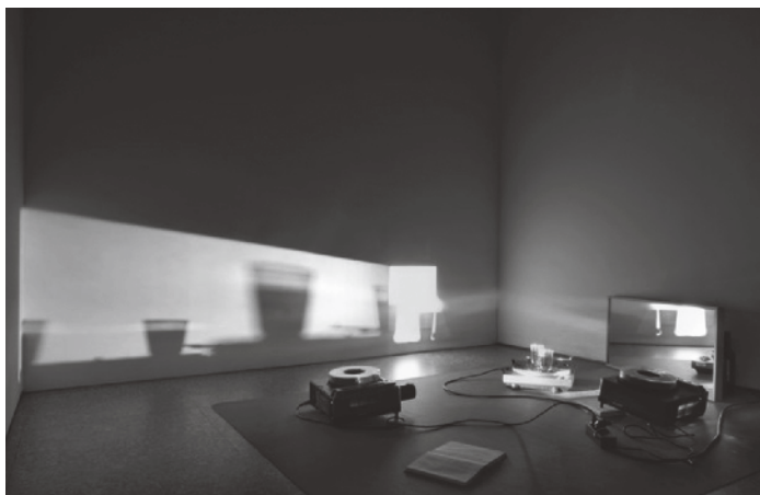
Figura 1 · Eulália Valldosera, Love's Sweeter than Wine. Tres estadios en una relación , 1993. Instalación lumínica . Fuente: Eulália Valldosera©VEGAP, 2009