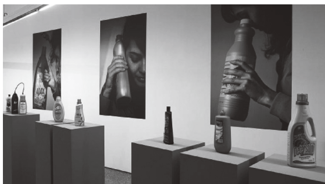
Figura 10 · Eulália Valldosera. Dependencias. Botellas interactivas . 2009. Instalación interactiva. Museo Nacional Centro de Arte Reina Sofía.