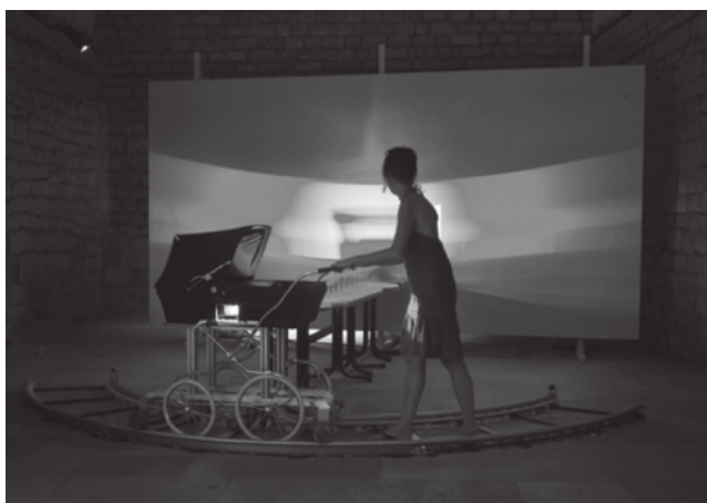
Figura 3 · Eulália Valldosera, El comedor: la figura de la madre , 1993.

Instalación lumínica con proyectores de diapositiva sin diapositiva, mobiliario doméstico y envases de productos de higiene, comestibles y medicinas. Fuente: Eulália Valldosera©VEGAP, 2009