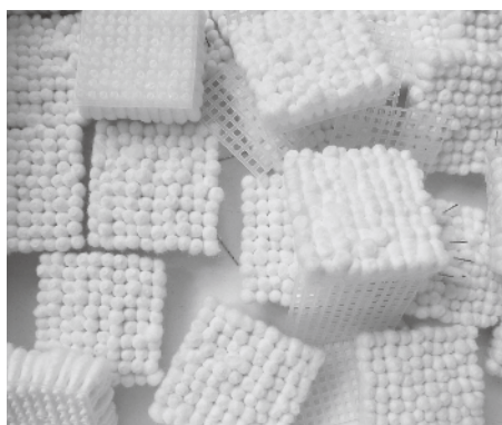
Figura 1 · Deserto 2013 , Cotonete, acrílico, alfinete e grade plástica, 35x 290x 2 cm.