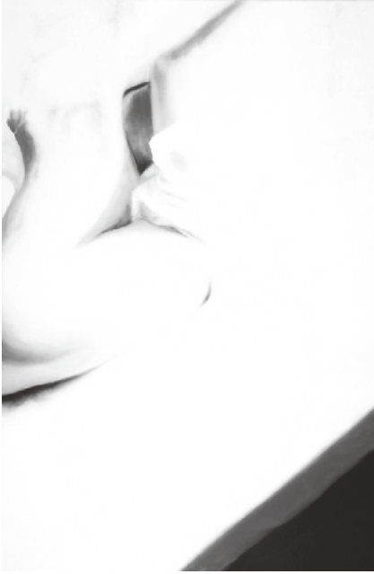
Figura 1 · Fotografia de Ricardo Guerreiro Campos, Prólogo , óleo s/ tela, (89 x 130) cm, 2013.