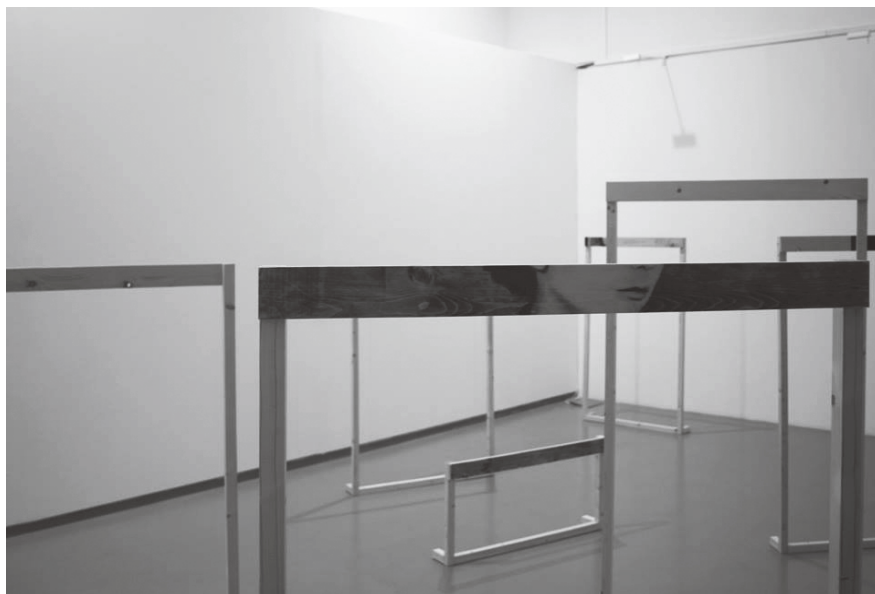
Figura 3 · Fotografia de Ricardo Guerreiro Campos, O tempo em que o silêncio se desfaz. Impressão jacto de tinta s/ papel algodão, 35 x 50 cm. Exposição Arquivo Fotográfico Municipal, Lisboa, 2014