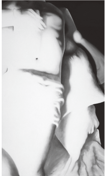
Figura 2 · Fotografia de Ricardo Guerreiro Campos, O Silêncio óleo s/ tela, (90 x 150) cm, 2013.