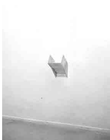
Figura 1 - Ángeles Marco. Torre. Palanca , 1986 (Serie: Salto al Vacío ). Hierro. 224x47x55 cm.