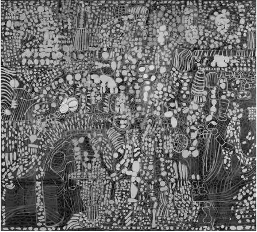
Figura 1 · Santi Queralt, Cardinal de Nápoles, 2010. Óleo sobre tela, 175 x 195 cm.