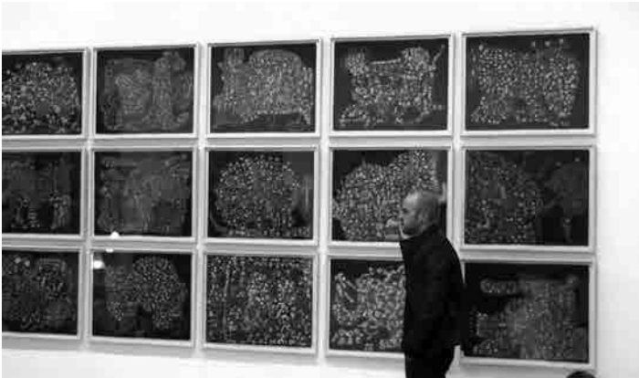
Figura 3 · Santi Queralt, Enamoradas (detalle), 2010-11. Óleo sobre tela, 175 x 195 cm.