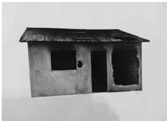
Figura 1 · Marcos Fioravante, Campus, Cliver, Trintaquatro, Oito, Trinity, Duque . Série de desenhos com pastel sobre papel, medindo cada 30 x 40 cm. 2014.