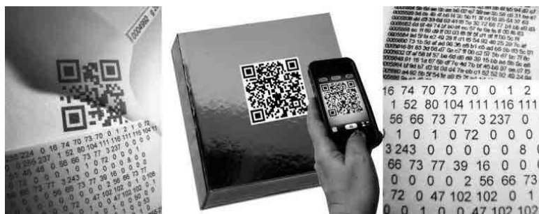
Figura 3 · Maria Lucia Cattani, Sete dias — one week, 2000. Imagem disponível em <URL: http://www.marialuciacattani.com/