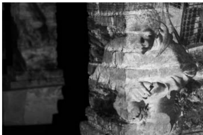
Figura 3 - Elaine Tedesco, Guri no Parque , 1980 — 2013. Imagem digital impressa, 90 x 60 cm.