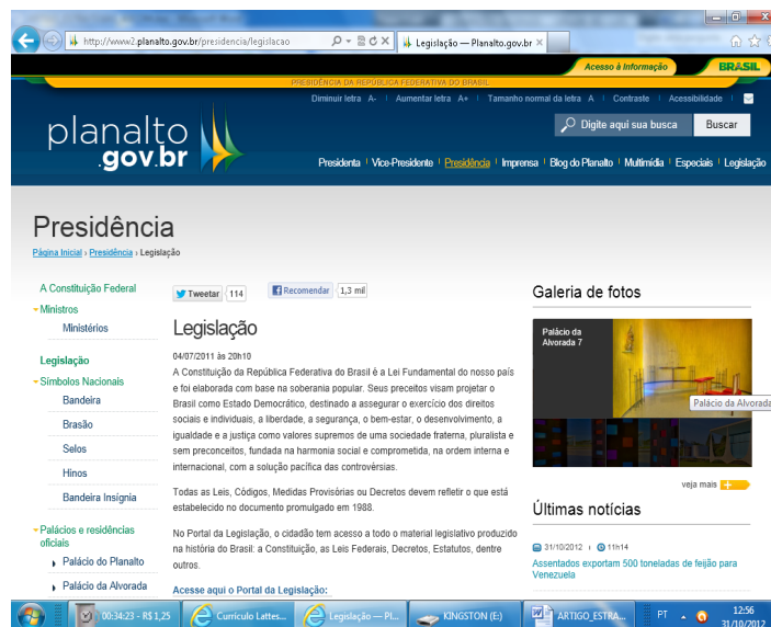
Figura 16 – Link Legislação

No link Legislação (figura 16), a presidência da República disponibiliza: link para a Constituição Federal de 1988, além de links para acessar Códigos, Leis ordinárias, Decretos, Resenha Diária, Medidas Provisórias. Ainda no link Legislação constam informações sobre os Ministros do governo de Dilma, Símbolos Nacionais, Palácios e residências oficiais, Estrutura da Presidência, Biblioteca da Presidência e Galeria de Presidentes.