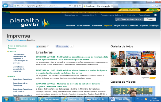
Figura 10 – Link Brasileiras