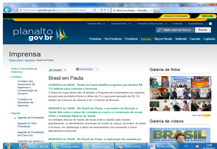
Figura 9 – Link Brasil em Pauta

Já no link Brasil em Pauta (figura 9), aparecem links do programa mensal que divulga informações e dados de temas como: programa que destina R$ 133 bilhões para rodovias e ferrovias, plano de combate ao crack e a construção de novas UPAs e Unidades Básicas de Saúde, redução dos juros e portabilidade da conta.