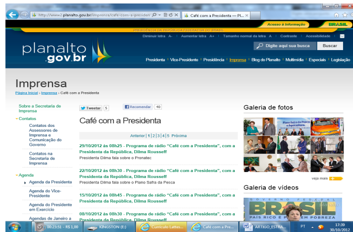
Figura 6 – Link Café com a Presidenta

No link Café com a Presidenta (figura 6), incluído no item Imprensa, aparecem os links dos programas de rádio divulgado a cada sete dias. As entrevistas são digitadas e também é disponibilizado um link para ouvir as entrevistas na íntegra.