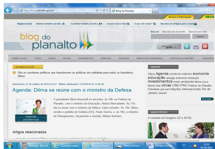
Figura 13 – Link do Blog do Planalto

Ao lado do link Imprensa, na página principal, aparece o Blog do Planalto com: Destaques, Sobre o blog, Fotos, Vídeos, Áudios, Infográficos, Especiais, Assuntos, Perguntas & respostas, Críticas & sugestões e Cadastre-se. Na página são postadas as principais notícias envolvendo a agenda da Presidente Dilma.