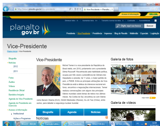
Figura 3 - Link Vice-Presidente