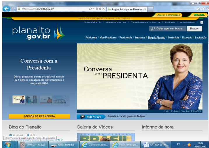
Figura 1- página principal do portal da presidência da República