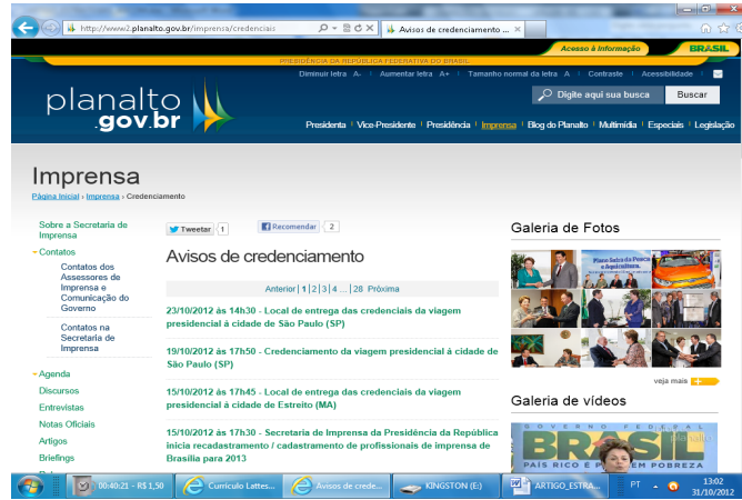
Figura 11 – Link Credenciamento