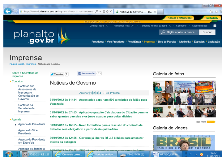
Figura 5- Link Imprensa

Já no link Imprensa nas Notícias de Governo (figura 5), existem notícias, galerias de fotos e de vídeos e os links: Sobre a Secretaria de Imprensa, Contatos dos Assessores de Imprensa e Comunicação do Governo, Contatos na Secretaria de Imprensa, Agenda da Presidenta, Agenda do Vice-Presidente, Agenda do Presidente em Exercício, Agenda de janeiro a julho de 2011, além de Discursos, Entrevistas, Notas Oficiais, Artigos, Briefings, Releases, Notícias de Governo, Café com a Presidenta, Conversa com a Presidenta, Bom Dia Ministro, Brasil em Pauta, Brasileiras, Credenciamento e Relatórios da Secretaria de Imprensa.