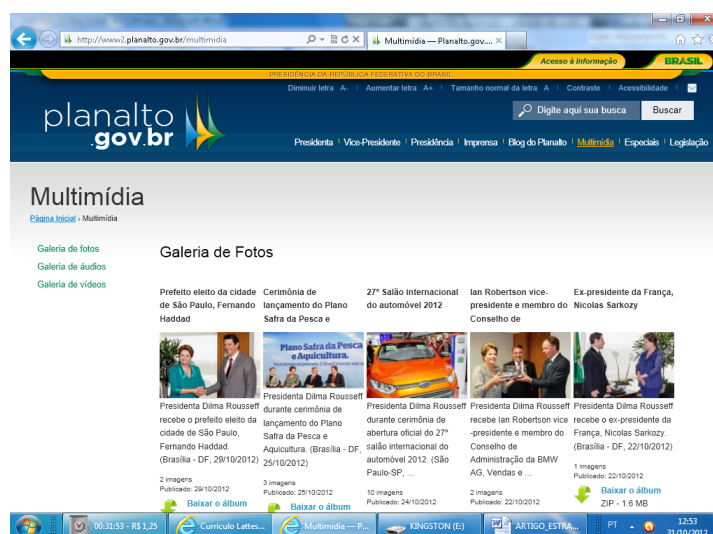
Figura 14 – Link Multimídia

Também na página principal consta o link Multimídia (figura 14), com Galeria de fotos, Galeria de Áudios e Galeria de Vídeos.