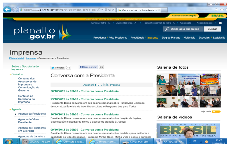
Figura 7 – Link Conversa com a Presidenta

No link Conversa com a Presidenta (figura 7), Dilma divulga uma coluna semanal sobre assuntos como: Programa Luz para Todos, doação de órgãos, Programa Minha Casa, Minha Vida, sobre programa de ensino integral Mais Educação, respondendo questões da população.