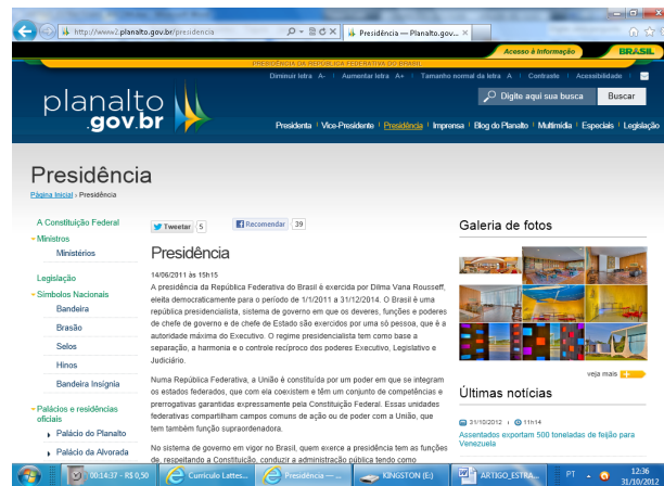
Figura 4 – Link Presidência Fonte: portal da presidência da República (2012)

No link Presidência (figura 4) constam os links: a Constituição Federal, Ministros, Ministérios, Legislação, Símbolos Nacionais, Bandeira, Brasão, Selos, Hinos, Bandeira Insígnia, Palácios e residências oficiais, Palácio do Planalto, Palácio da Alvorada, Granja do Torto, Palácio do Jaburu, Estrutura da Presidência, Biblioteca da Presidência, Galeria de Presidentes.