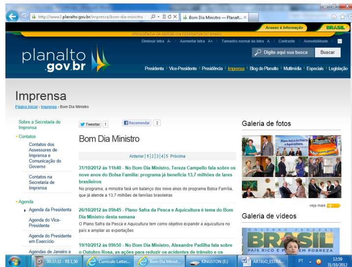
Figura 8 – Link do programa Bom dia Ministro

Já no link Brasil em Pauta (figura 9), aparecem links do programa mensal que divulga informações e dados de temas como: programa que destina R$ 133 bilhões para rodovias e ferrovias, plano de combate ao crack e a construção de novas UPAs e Unidades Básicas de Saúde, redução dos juros e portabilidade da conta.