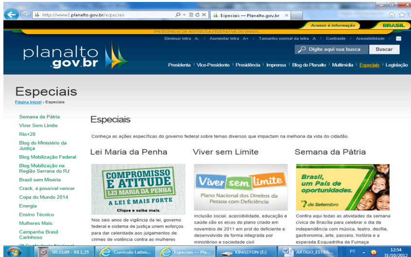
Figura 15 - Link Especiais

No link Especiais (figura 15) aparecem as ações específicas do governo federal sobre temas diversos como: Lei Maria da Penha, Viver Sem Limite, Semana da Pátria, Combate à Miséria, Criança e Adolescente, Brasil sem Miséria.