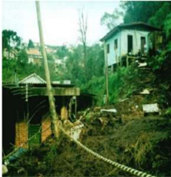
Imagem 6a. Condição das casas na ocupação, 1997