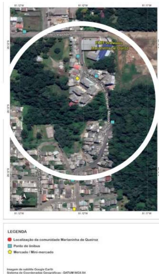
Imagem 2. Fotografia aérea da Comunidade/Cooperativa Habitacional Marianinha de Queiroz e sinalização dos serviços urbanos fundamentais

Além disso, também se fez necessário incluir uma fotografia aérea da comunidade (Imagem 2) em que é possível compreender seus limites territoriais e a disposição de serviços urbanos fundamentais.