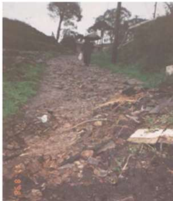
Imagem 4. Rua de acesso à comunidade em 1997