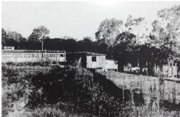
Imagem 3. Invasão no terreno da escola local