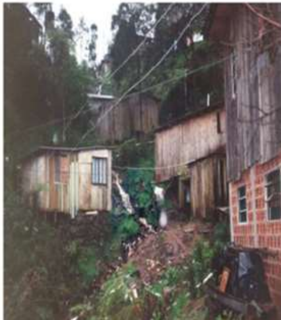
Imagem 6b. Condição das casas na ocupação, 1997