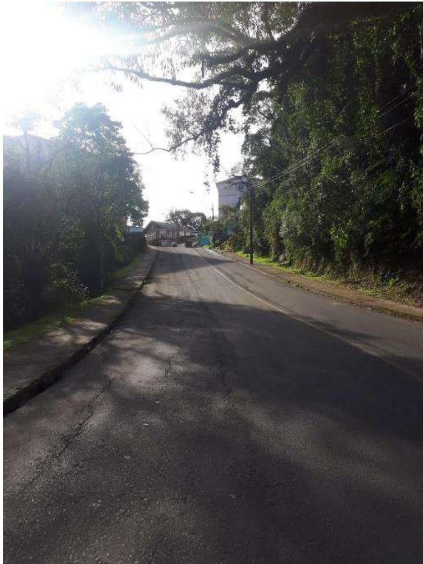
Imagem 5. Rua de acesso à comunidade atualmente