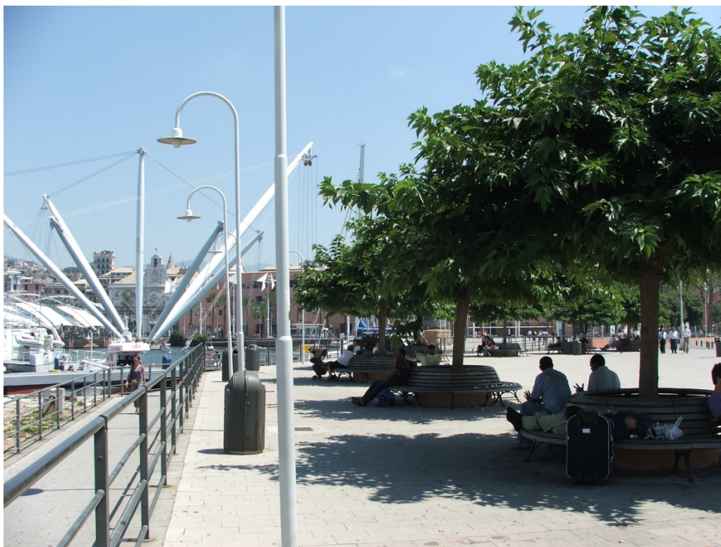
Figura 3. Vista geral do porto. Espaços públicos criados na Expo 92.

A primeira etapa do projeto de intervenção, a requalificação do porto antigo, foi confiada ao arquiteto genovês Renzo Piano. O projeto compreendeu uma área de 13 hectares e incluiu a maior parte do porto medieval e sucessivas alterações dos séculos XVI ao XIX (Figura 3). Inicialmente, foram construídos apenas dois edifícios novos: o Aquário e um bloco de serviços ao lado do antigo Armazém do Algodão, que foi adaptado para novo uso: salas expositivas, centro de convenções e outros serviços (Figura 4) 3 . Além dos novos edifícios, as áreas envoltórias foram trabalhadas em projeto paisagístico com a criação de amplos espaços públicos e equipamentos de serviços e lazer.