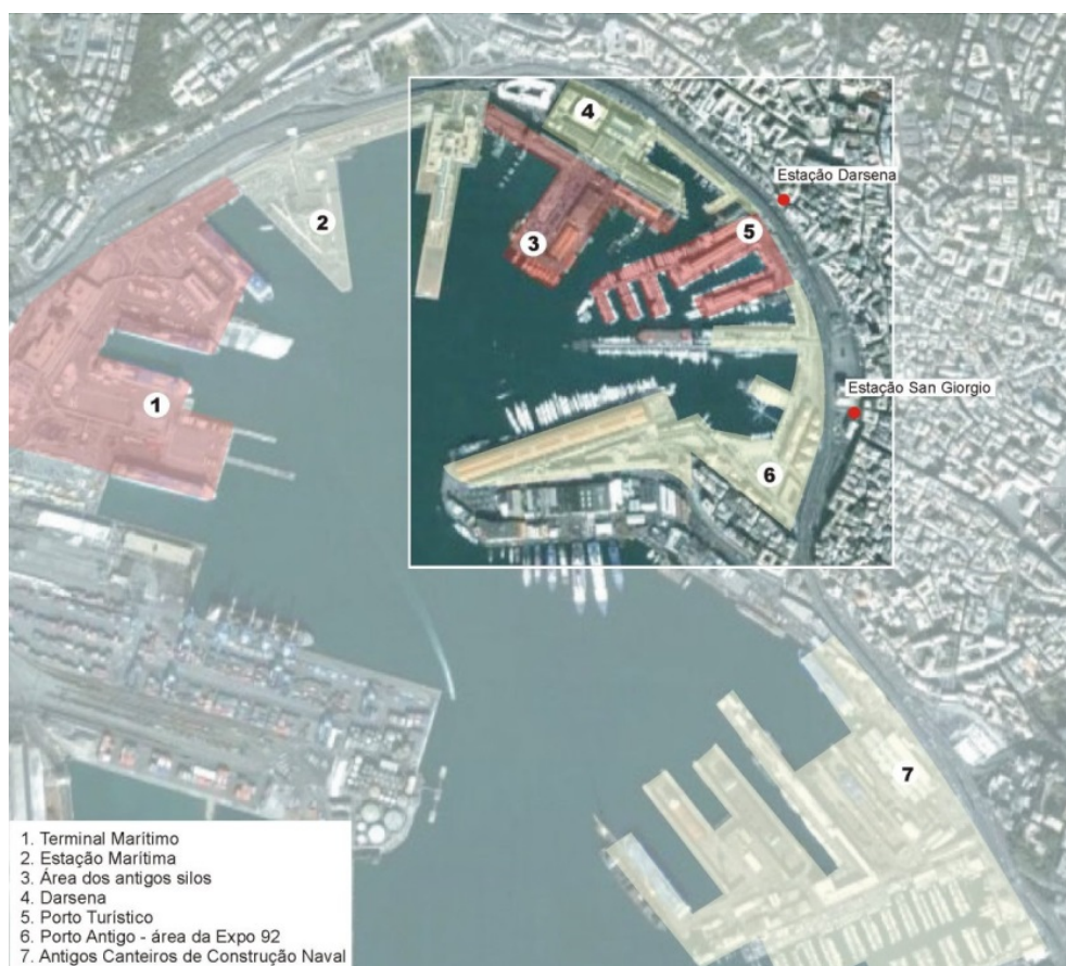
Figura 2. Porto histórico de Gênova. Em destaque, área onde se concentram os principais projetos de revitalização já executados ou em andamento (sem escala).

Por muito tempo o porto de Gênova assumiu a posição de principal porto italiano e as atividades industriais sediadas na cidade – muitas delas associadas às funções portuárias, a exemplo dos setores da produção naval e da siderurgia –, conferiam a Gênova um lugar de destaque entre os maiores centros industriais do país. Tanto as atividades portuárias, quanto as industriais, no entanto, começaram a entrar em declínio entre os anos 1960 e 1970. O porto não acompanhou as adaptações tecnológicas necessárias e tornou-se obsoleto. No final da década de 1980, com a reestruturação do Consórcio Portuário como sociedade público-privada e a reorganização de serviços e construção de novos terminais, o porto começou a buscar sua reinserção funcional, mas muitas das antigas estruturas ainda precisavam ser readaptadas para corresponder às novas atividades. A Expo 92, portanto, seria uma oportunidade para alavancar projetos de requalificação que já vinham sendo pensados.