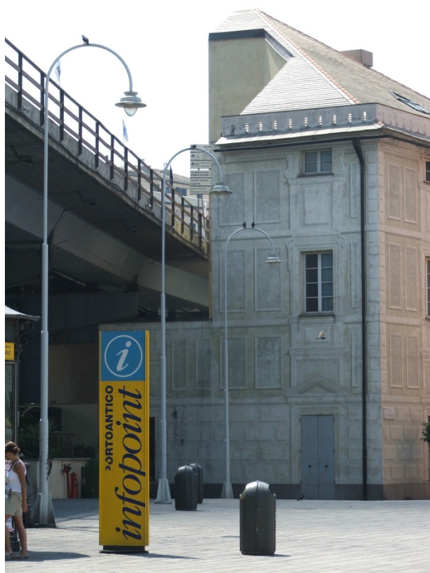
Figura 9. Antigos armazéns cortados pela via elevada.