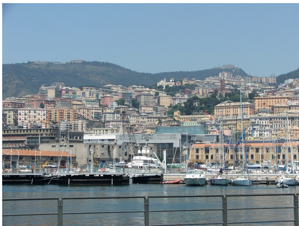
Figura 1. O porto de Gênova e a cidade histórica.