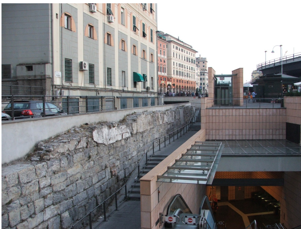
Figura 8. Entrada da Estação San Giorgio. Parte da estrutura de pedra das antigas plataformas portuárias foi deixada à vista.

Além da ruptura na paisagem, durante a construção da via elevada, armazéns portuários datados dos séculos XVII e XVIII foram parcialmente cortados (Figura 9). De maneira análoga, a construção do túnel e do sistema metroviário, na década de 1990, condenou as antigas estruturas portuárias que vieram à tona durante as escavações para realização das obras. Tratava-se das estruturas do sistema portuário medieval composto por plataformas de pedra e que ficara escondido sobre as sucessivas estratificações advindas das modernizações posteriores. As estruturas estavam intactas no subsolo e foram retiradas para a passagem do metropolitano, restando apenas uma parede que hoje está à mostra na entrada da estação (Figura 8). O sistema representava um testemunho único de arqueologia industrial e acabou sendo removido sem gerar muita discussão 6 .