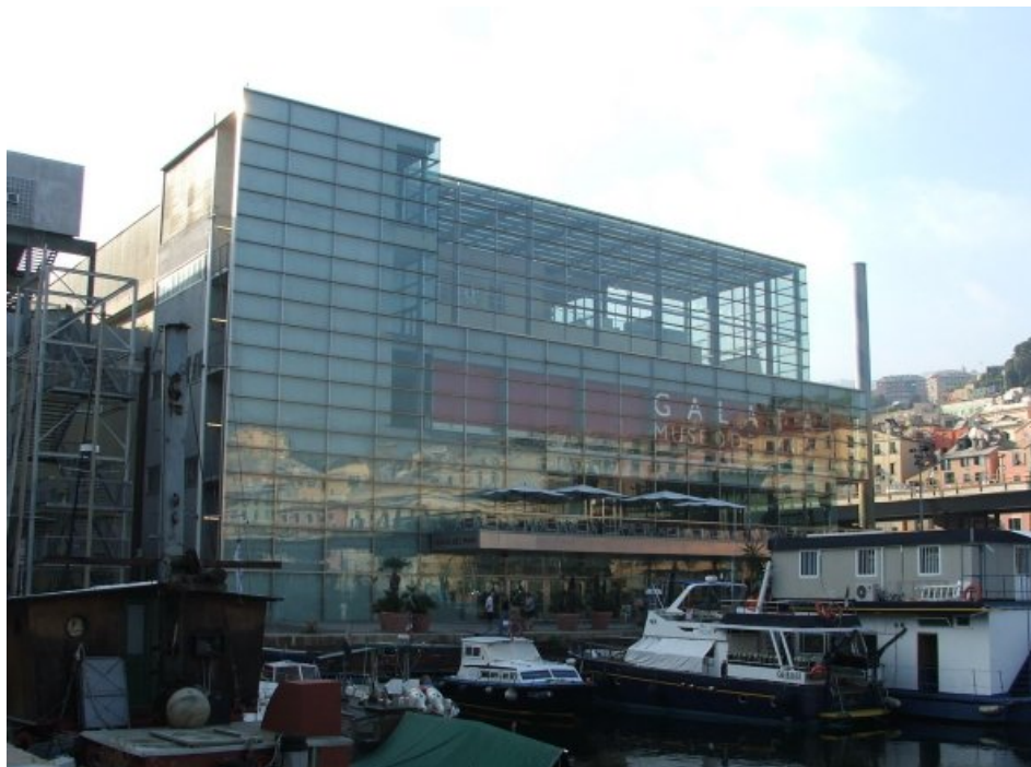
Figura 6. Museu do Mar e da Navegação, construído em um antigo estaleiro segundo projeto do arquiteto espanhol Guillermo Vázquez Consuegra.