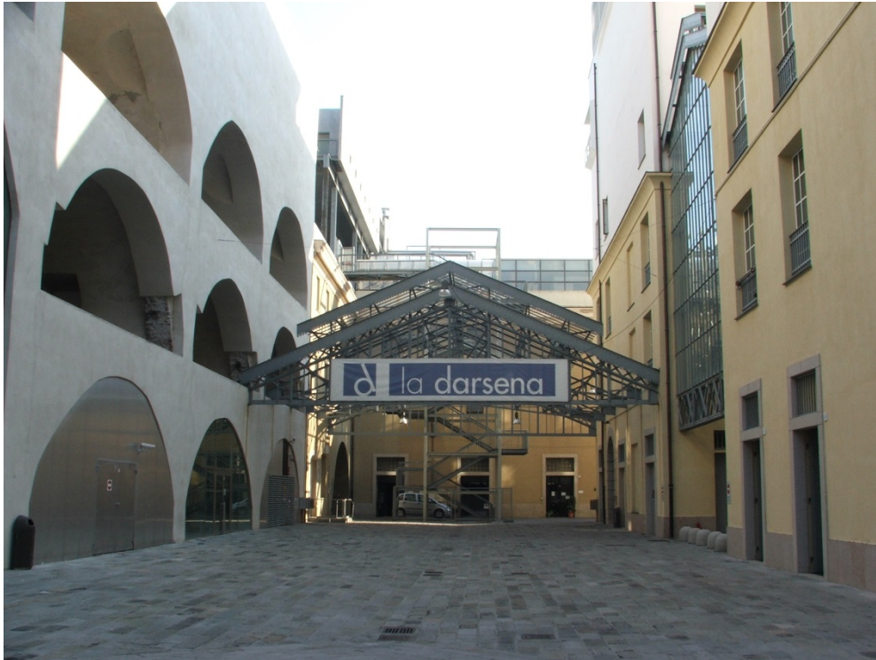
Figura 5. À direita, acesso à Faculdade de Economia e Comércio instalada em antigos galpões. Projeto de adaptação do arquiteto italiano Aldo Rizzo.