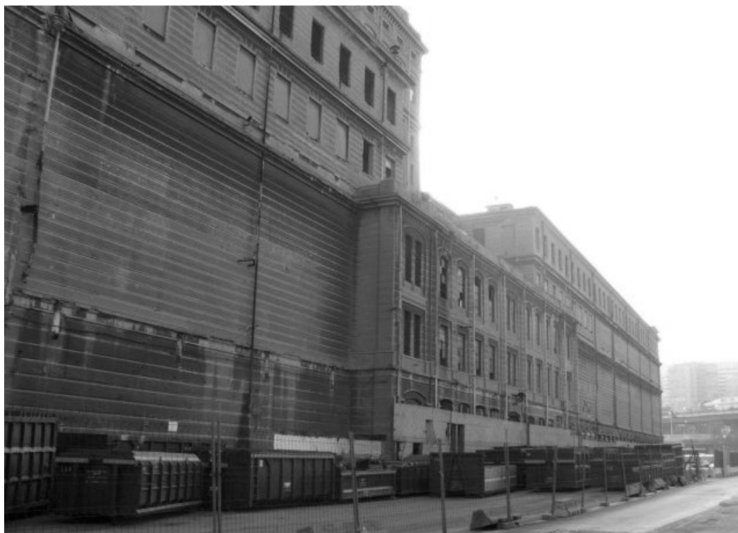
Figura 7. Silos de concreto armado atribuídos a François Hennebique.

Dentre os edifícios abandonados cujas particularidades formais e estruturais dificultam a escolha de um novo uso compatível, destacam-se os silos construídos em concreto armado, segundo projeto atribuído ao engenheiro francês François Hennebique (1841-1921), talvez o primeiro edifício construído nesse sistema na Itália (Figura 7). Na década de 1990, cogitou-se recuperar os enormes silos para abrigar um hotel (Poleggi, 1991:14) e, no início dos anos 2000, surgiu a proposta de instalar ali a Faculdade de Engenharia, projeto que estaria a cargo de Rem Koolhaas e Stefano Boeri (Gabrielli, 2005:35). Atualmente o edifício está abandonado.