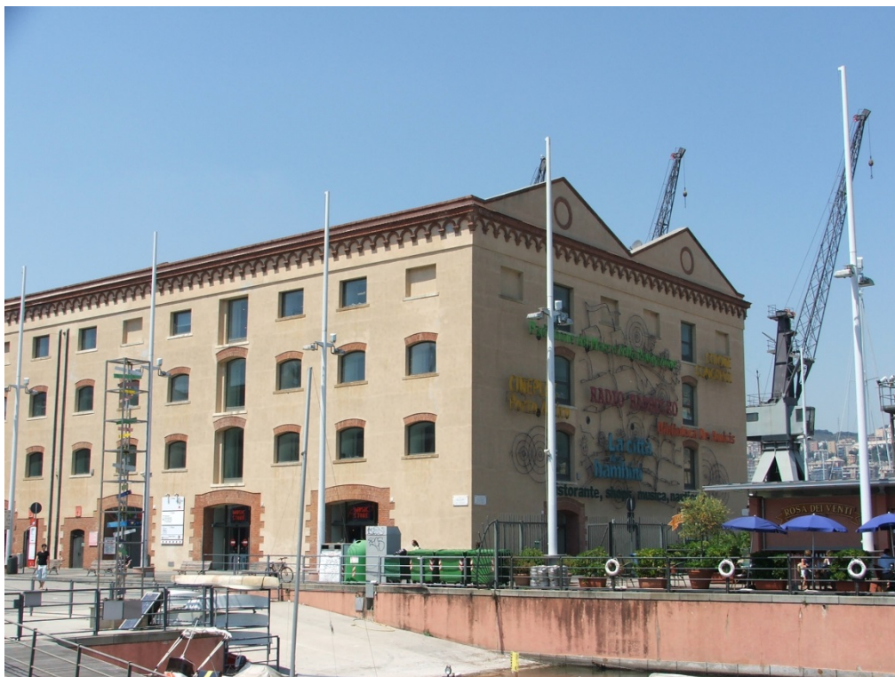
Figura 4. Antigo Armazém do Algodão: adaptado para espaços culturais e comerciais.