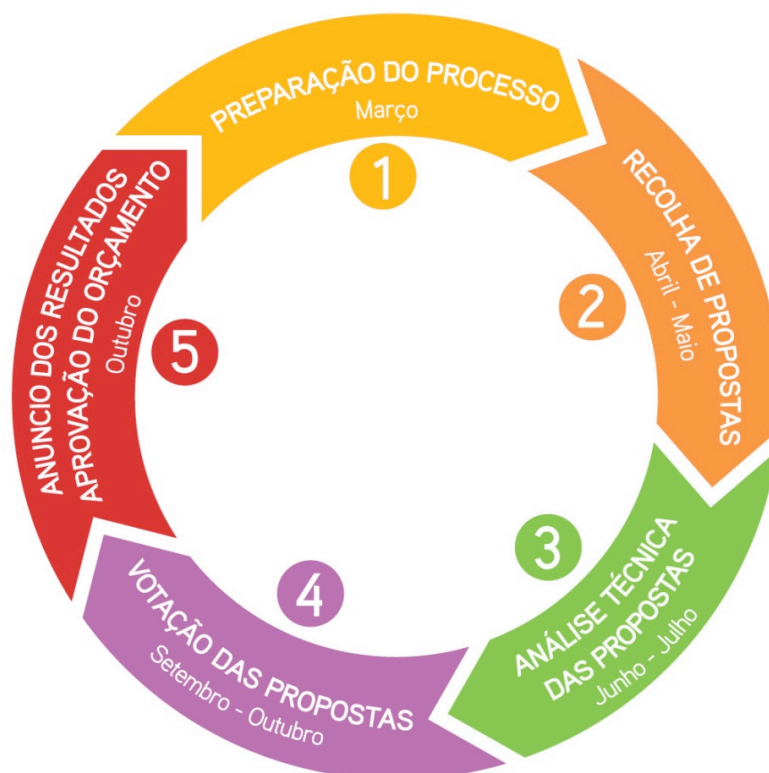
Imagem 1. Ciclo anual do OP de Cascais