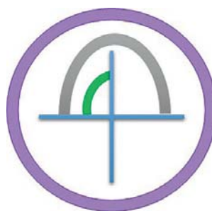
Figura 01: Os doentes foram divididos do seguinte modo: (1) presença de trombo no colo aneurismático (versus ausência de trombo) linha roxa; (2) trombo em menos de 25% da circunferência do colo aneurismático (linha verde) versus igual ou superior a 25% e (3) trombo em menos de 50% da circunferência do colo aneurismático (linha cinzenta) versus igual ou superior a 50%

estudamos a relação entre LRA e a presença de trombo no colo aneurismático (figura 1) e tipo de endoprótese utilizado (fixação supra ou infra renal). Da base de dados de 241 doentes foram excluídos os doentes insuficientes renais crónicos em hemodiálise à data do procedimento e aqueles em que não dispúnhamos de análises com função renal no pré/pós-operatório. Relativamente ao estudo da relação entre endoprótese utilizada e função renal: 127 foram tratados com endopróteses de fixação supra-renal, 74 com endopróteses de fixação infra-renal e 27 foram excluídos da análise por terem sido tratados com endopróteses torácicas ou não dispormos dessa informação. Relativamente ao estudo do trombo do colo aneurismático, conseguimos esse dado para 190 da totalidade de doentes da base de dados.