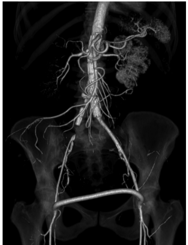
Figura 4 Angio-TC pós-operatória.