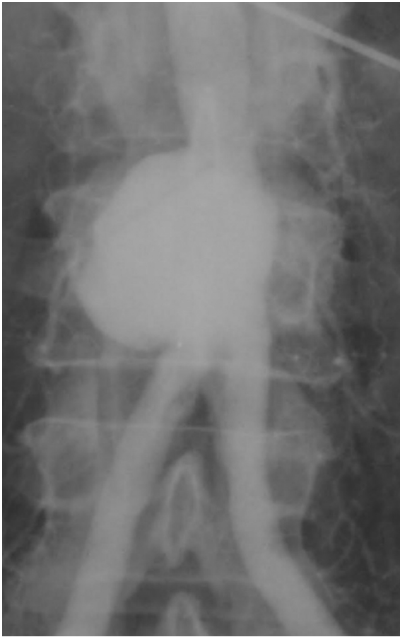
Figura 1 Imagem da arteriografia.