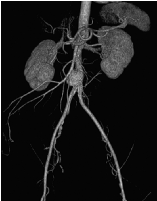
Figura 2 Angio-TC pré-operatória.